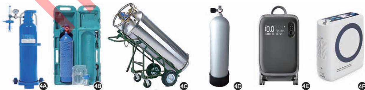
图4 家庭氧疗常见供氧装置示意图 4A 固定式氧气瓶;4B 便携式氧气瓶;4C 液态氧固定式铝罐;4D 液态氧便携式铝罐;4E 固定式制氧机;4F 便携式制氧机

其他吸氧面罩,如储氧面罩、文丘里面罩,对供氧装置要求较高,操作较为复杂,一般不建议用于