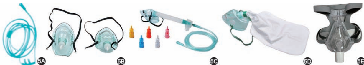
图5 家庭氧疗不同吸氧装置示意图 5A 鼻导管;5B 普通面罩;5C 文丘里面罩;5D 储氧面罩;5E 无创面罩

1.制氧机的使用:制氧机应放置在平稳的地面上,周围无热源或明火,阴凉可通风,切忌在制氧机上覆盖物品。湿化瓶内严格按照刻度线加水,高于最低水位线,低于最高水位线。出氧口接入消毒后的湿化瓶和吸氧管路,然后开启制氧机,通过